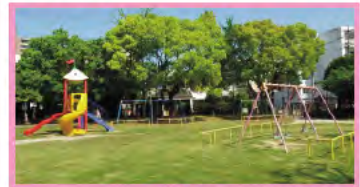
すべり台、ブランコ、 砂場等で遊べます。