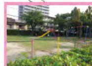
すべり台、ブランコ、砂場等で遊べます。