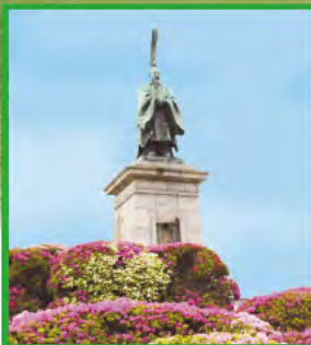
県庁正面から東公園を見ると 亀山上皇像が中心に見えます。 春になるとつつじが周りを囲み、 像が引き立ちます。